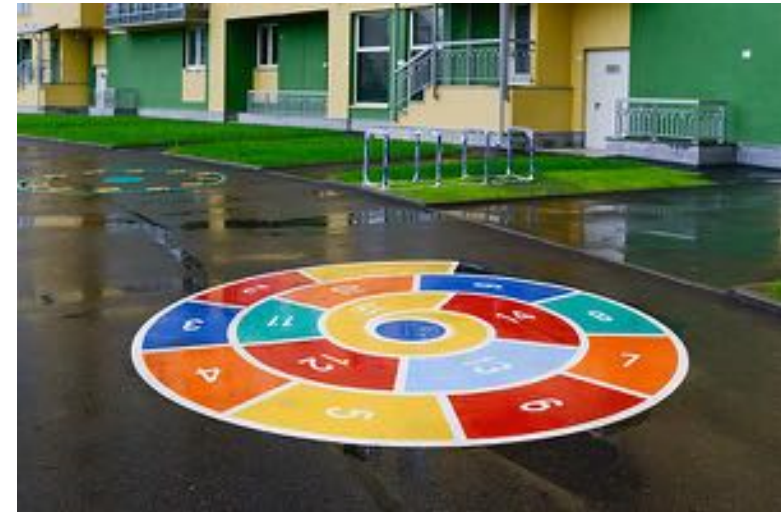
Cirkler i termoplast - principfoto

Af egesveller opbygges tribune pladser og kanter til at slide på. Rigtig gode som tilskuerpladser, til gruppearbejde, til når flere skal have en fælles besked eller måske til klassefotos. I forbindelse med bevægelse kan de også anvendes som step-bænke og som del af skatebanen..